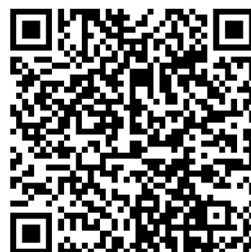
QR3 / Memes racistas