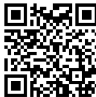
QR4 / “Arquetipos...”

En este video presentamos un recorrido por distintos arquetipos de personas marrones-indígenas mediante una revisión histórica de obras. Las artes visuales argentinas han sido predominantemente habitadas por una perspectiva blanca y es difícil, hasta el día de hoy, dar visibilidad a artistas marrones-indígenas.