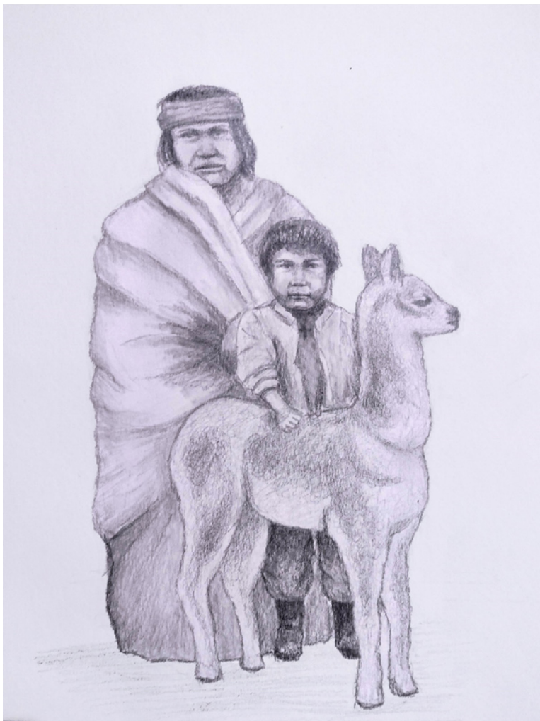
27 Dibujo de Soledad Apaza, inspirado en su visita al museo.